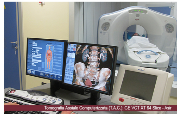
Tomografia Assiale Computerizzata (T.A.C.): GE VCT XT 64 Slice - Asir

Amministrazione Sala Riunioni Sala Conferenze Ospitalità