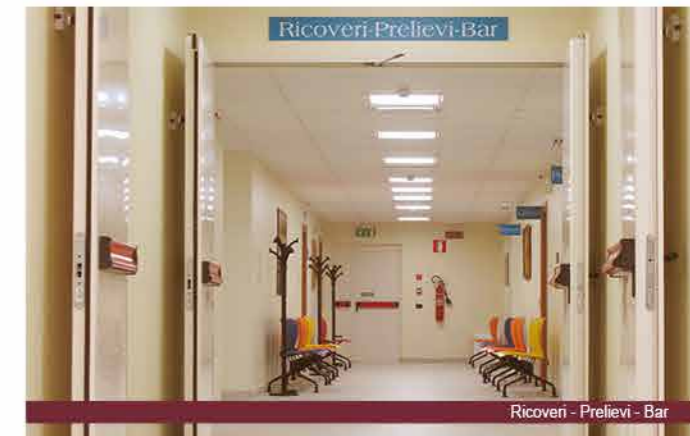
Ricoveri - Prelievi - Bar

Ufficio Tecnico - Deposito Farmaceutico Ufficio Acquisti Mensa - Cucina centralizzata Guardaroba Morgue Locali Archivio Ristorante Chiesa