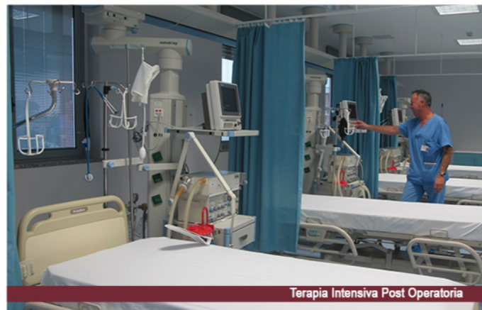
Terapia Intensiva Post Operatoria

Reparti di degenza Polispecialistica (Medicina Generale, Chirurgia Generale, Urologia, Oculistica, Ortopedia) Laboratorio Analisi – Palestra – Blocco Operatorio Polispecialistico (2 sale)