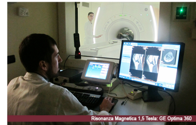
Risonanza Magnetica 1,5 Tesla: GE Optima 360