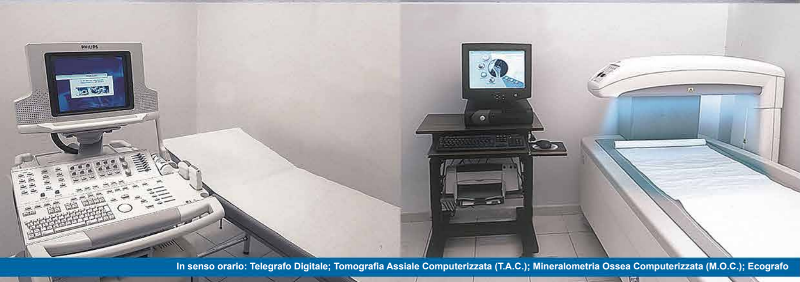
In senso orario: Telegrafo Digitale; Tomografia Assiale Computerizzata (T.A.C.); Mineralometria Ossea Computerizzata (M.O.C.); Ecografo