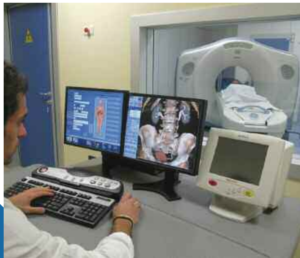
TOMOGRAFIA ASSIALE (TAC) GE VCT XT 64 SLICE - ASIR

zie al software ASIR (che riduce sino al 50% le dosi di radiazioni). Questa peculiarità consente a coloro che soffrono di patologie oncologiche di poter usufruire di indagini di altissima risoluzione con minore esposizione a radiazioni.