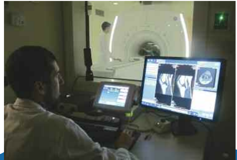
RISONANZA MAGNETICA 1,5 TESLA GE OPTIMA 360

Per costoro è ora possibile effettuare esami diagnostici su un'apparecchiatura ad alto campo magnetico (1,5 tesla), non ottenibili sulle cosiddette Risonanze aperte, grazie al fatto che la RM Optima dispone di un tunnel decisamente più corto (140 cm di lunghezza). Di fatto questa innovativa apparecchiatura unisce le virtù delle risonanze ad alto campo magnetico (per definizione di immagine) a quelle delle risonanze aperte, accessibili a pazienti claustrofobici.