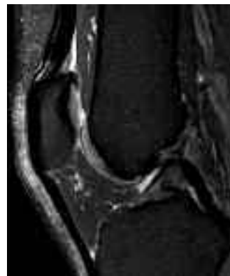
RM MUSCOLO SCHELETRICA (GINOCCHIO)

il funzionamento del muscolo cardiaco in movimento. In tal modo il radiologo è in grado di valutare il funzionamento del muscolo cardiaco in movimento . Sempre per quanto riguarda la risonanza magnetica cardiaca, ma più in genere di tutti gli organi del corpo umano, è di assoluto rilievo l'analisi perfusionale che consente di evidenziare eventuali necrosi (parte degli organi che non sono irrorate di sangue). Questo tipo di diagnosi è essenziale per la determinazione degli effetti di un infarto sul