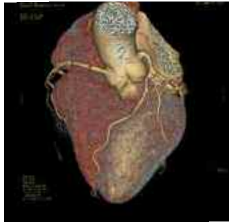
CARDIO-TC TRIDIMENSIONALI: CONTROLLO BYPASS AORTOCORONARICO (A SINISTRA) E SCREENING PER MALATTIE CORONARICHE (A DESTRA)

In ambito cardiovascolare per l'esame delle coronarie effettuato con precedenti apparecchiature il costo biologico (la dose di radiazioni assorbite dal paziente) variava tra i 10 e i 25 msv (msv sta per millisivert e le radiazioni che si trovano in natura variano da 1-5 msv/anno) con la XT invece la dose è ridotta dal 30% al 50%, portando così il costo biologico di una TAC agli stessi livelli di quello di una coronarografia, con differenze sostanziali però in termini di invasività oltre alla riduzione della quantità del liquido di contrasto. Notevoli riduzioni di radiazioni assorbite si hanno anche sul resto del corpo, pur ottenendo maggiore nitidezza e definizione dei profili anche per quelle lesioni che non superano i 3 millimetri di diametro.